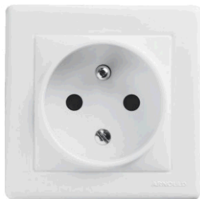
figure : PC 2P+T

Les socles de prise de courant réservés à la zone utilisée pour le poste de télétravail doivent impérativement être d'un modèle deux pôles avec plot de terre (modèle ci-dessous à gauche) Le modèle ci-dessous à droite deux pôles uniquement ne sont pas acceptés.