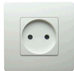
figure : PC 2P